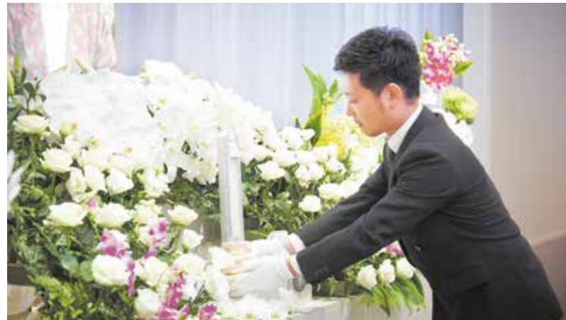
仏式から神式、キリスト教式まで、あらゆるご葬儀に対応した祭壇を準備します。会社が執り行う社葬では近年、従来のスタイルにとらわれない演出が増え、プロジェクションマッピングを用いたオリジナルの祭壇も好評いただいています。

互助会なら突然訪れる別れの日にも、故人様の人生を讃え、その生き方に恥じないご葬儀を執り行うことができます。