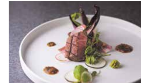
フレンチと和食が融合したオリジナルの婚礼料理。