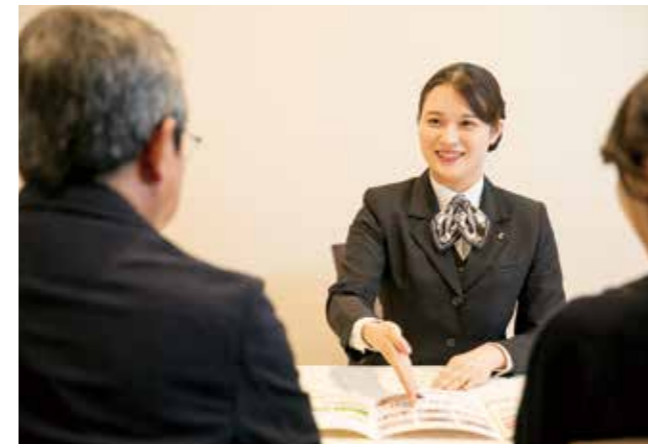
もしもの時は、お電話ください。24時間・365日対応いたします。

人生の最期に対する考え方が柔軟に広がっている今、ご葬儀のあり方も変化しています。そうした変わりゆく時代においても変わらないのが、大切な人とのお別れに直面する人々の想いです。その人らしいフィナーレを飾り、旅立ちをまごころ込めて見送るご葬儀は、人と人の絆を未来につないでいきます。