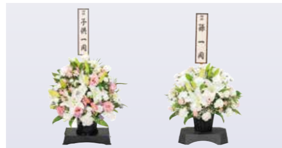
故人様の枕元に飾り、哀悼の意を伝える枕花。ご遺族のお気持ちに寄り添う花々をご用意します。ご要望に応じて送り主を明記した立札もお付けします。