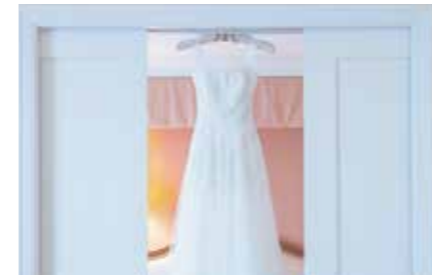
様々な結婚準備のご相談に応じます。