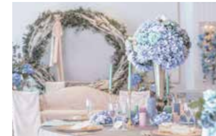
お二人らしい演出をまごころ込めてプロデュース。