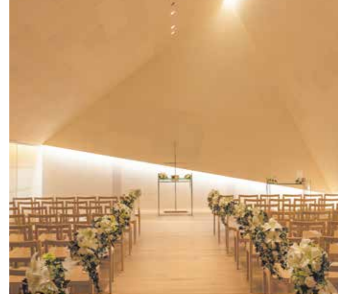
多彩なスタイルから挙式形式をお選びいただけます。

結婚に対する考え方が多様になり、それぞれの幸せの形を自由に描く時代。それでも多くのカップルは、ご家族やご親族、ご友人、お世話になったさまざまな方々に感謝の気持ちや誓いの言葉を直接伝えたいと考え、「結婚式を挙げる」という選択をしています。人生をともに歩み始めたお二人がつくるセレモニーは、祝福する皆様にあたたかな感動を届けます。