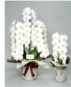
透き通るような白い花は「弔い」の色。絆花は、ご遺族様の心にそっと優しく寄り添います。