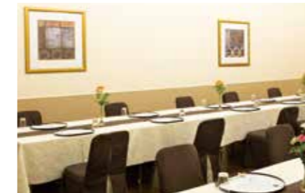
ゆったりとした会食ホール。