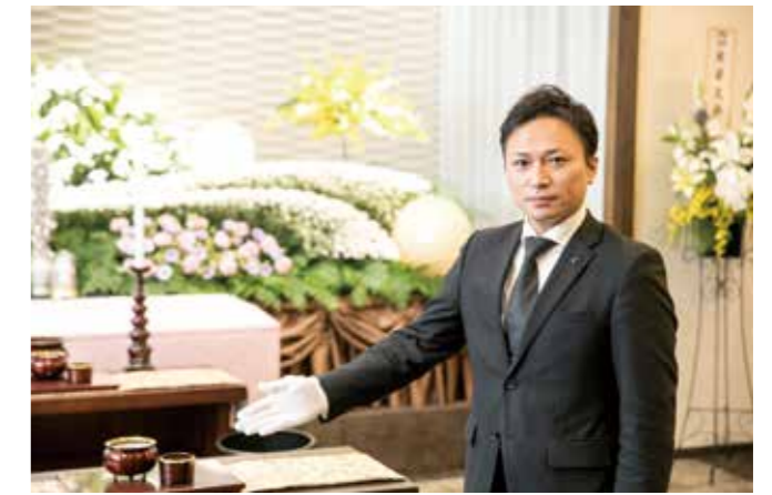
まごころを込めた“ゆったり葬儀”を大切にしています。