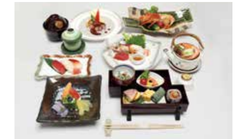
おもてなし料理をご提供します。