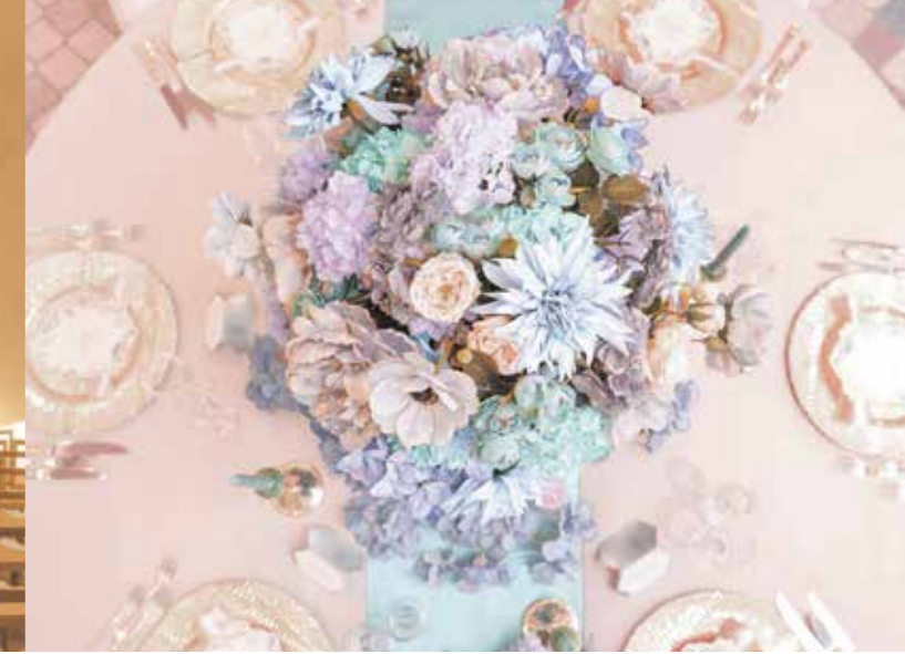
インテリア、食器、カトラリーなど細部までこだわる空間づくり。