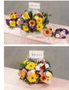
お供えのカードにご芳名や、メッセージを記入できます。