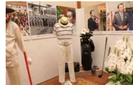
在りし日の姿を偲ぶメモリアルコーナー。